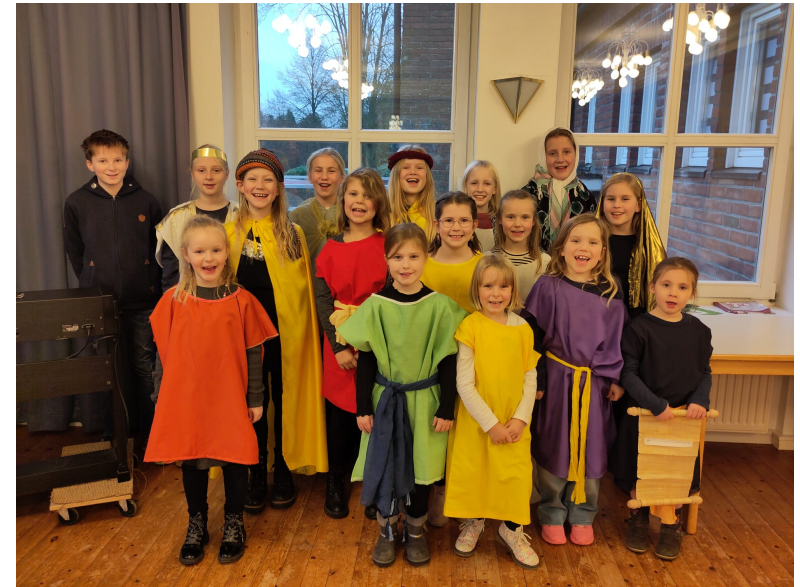
Die Premiere des Weihnachtsmusicals in der „Kleinen Christnacht“