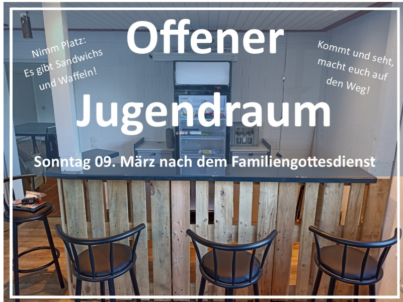
Nach fröhlicher Bauzeit entsteht ein neuer Jugendraum!