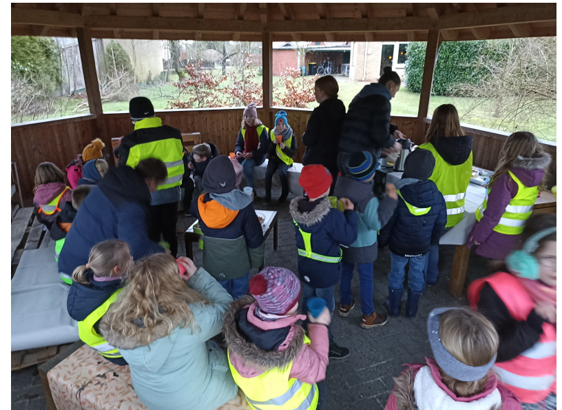
Ein buntes Treiben zum Kloatscheeten der Jungschar im Januar