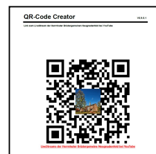
QR-Code – Live-Stream