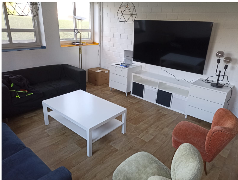
Gestaltet und gebaut von Jugendlichen unterschiedlichen Alters!