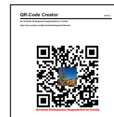
QR-Code – YouTube-Videos